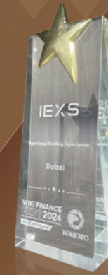
Pengalaman Trading Forex Terbaik

Pada September 2021, IEXS dianugerahi penghargaan "Broker Fintech Forex Terbaik di Eropa untuk tahun 2020". Penghargaan ini diberikan setelah analisis komprehensif terhadap perusahaan-perusahaan berkinerja terbaik di berbagai pasar dan merupakan salah satu evaluasi tahunan paling otoritatif dan berpengaruh di industri ini.